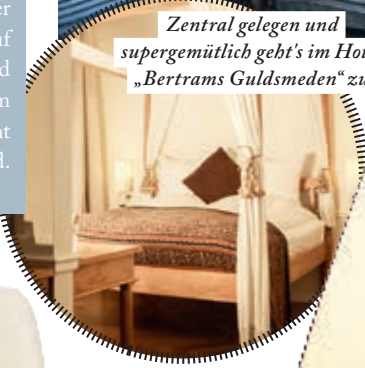
Zentral gelegen und supergemütlich geht's im Hotel „Bertrams Guldsmeden“ zu