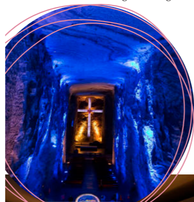
Spektakulär: die Salzkathedrale Zipaquirá und das Museo del Oro

Text: Nicola König; Fotos: Horan, Christian/ Four Seasons (3), Shutterstock, boghotel.com