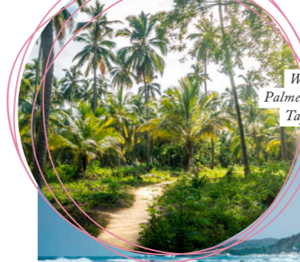
Welcome to the jungle: Palmen satt im Regenwald des Tayrona Nationalparks

Text: Nicola König; Fotos: Horan, Christian/ Four Seasons (3), Shutterstock, boghotel.com