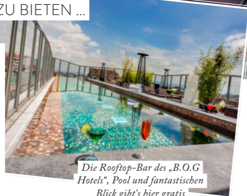
Die Rooftop-Bar des „B.O.G Hotels“, Pool und fantastischen Blick gibt's hier gratis