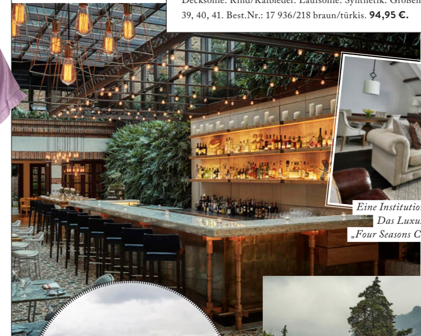
Eine Institution in Bogotá: Das Luxus-Hotel „Four Seasons Casa Medina“.

8. T-SHIRT von ODEON. Länge von ca. 66 cm. 95% Viskose, 5% Elasthan. Größen: XS, S, M, L, XL. Best.Nr.: 20 535/718 flieder. 39,95 €. 9. CARGOHOSE von REPLAY. Innenbeinlänge ca. 66 cm. 97% Baumwolle, 3% Elasthan. Größen: 26, 27, 28, 29, 30, 31, 32. Best.Nr.: 15 949/718 rosé. 129 €. 10. SNEAKER von REPLAY. Plateauhöhe ca. 3 cm. Obermaterial: Textil. Decksohle, Futter: Textil. Sohle: Synthetik. Größen: 36, 37, 38, 39, 40, 41. Best.Nr.: 21 072/018 silberfarben. 99,95 €.