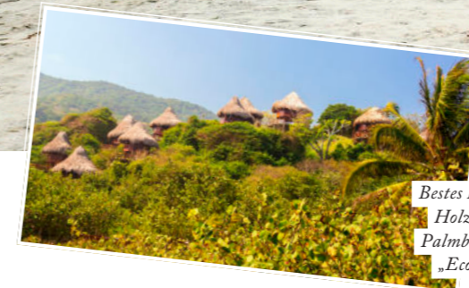
Bestes Hotel? Die coolen Holzbungalows mit Palmblatt-Dächern des „Ecohabs Tayrona“