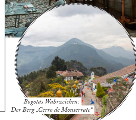
Bogotá's Wahrzeichen: Der Berg „Cerro de Monserrate“